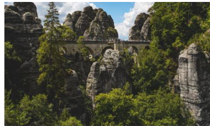
Die Bastei in der Sächsischen Schweiz ist wohl eine der bekanntesten Felsformationen