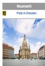
Orgelndacht m. Führung