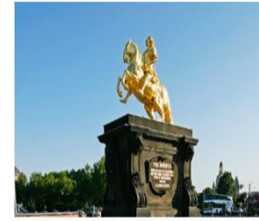
Der Goldene Reiter in der Inneren Neustadt.