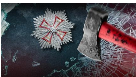
Einbruch im November 2019