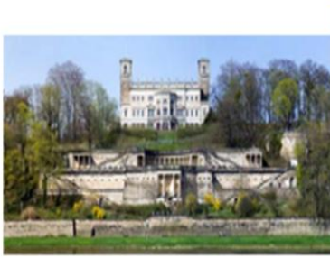
Albrechtsberg mit Terrassen