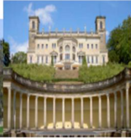
Albrechtsberg mit Arkadenhalbrund