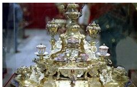
Das Goldene Kaffeezeug (1697–1701) 1708)